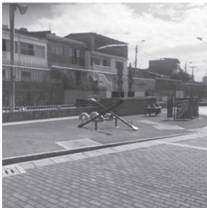
FOTO 16. PARQUE LA HORQUETA