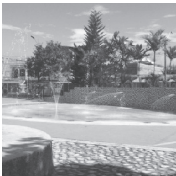
FOTO 14. ZONA DE CHORROS, PARQUE LAS ACACIAS

Fuente: Registro fotográfico en visita de campo