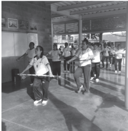
FOTO 13. GRUPO ADULTO MAYOR - CLASE DE BAILE, PARQUE LAS ORQUÍDEAS