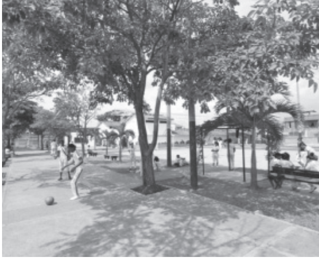
FOTO 12. PARQUE LAS ORQUÍDEAS, DESPUÉS DE LA INTERVENCIÓN DE LA FUNDACIÓN FANALCA