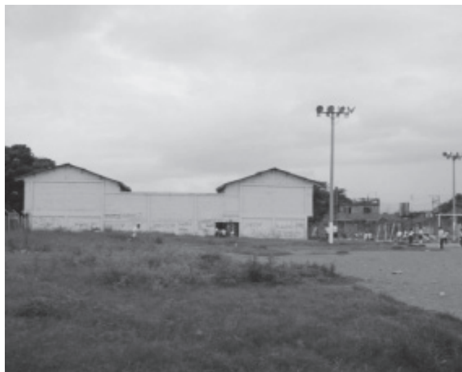
FOTO I I . PARQUE LAS ORQUÍDEAS, ANTES DE LA INTERVENCIÓN DE LA FUNDACIÓN FANALCA