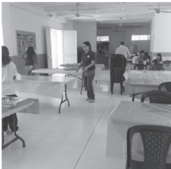
FOTO 10. ADECUACIÓN COMEDOR ESCOLAR

Fuente: Registro fotográfico en visita de campo