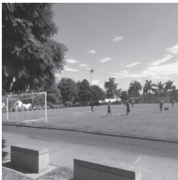
CANCHA DE FÚTBOL PROFESIONAL, PARQUE LAS ACACIAS