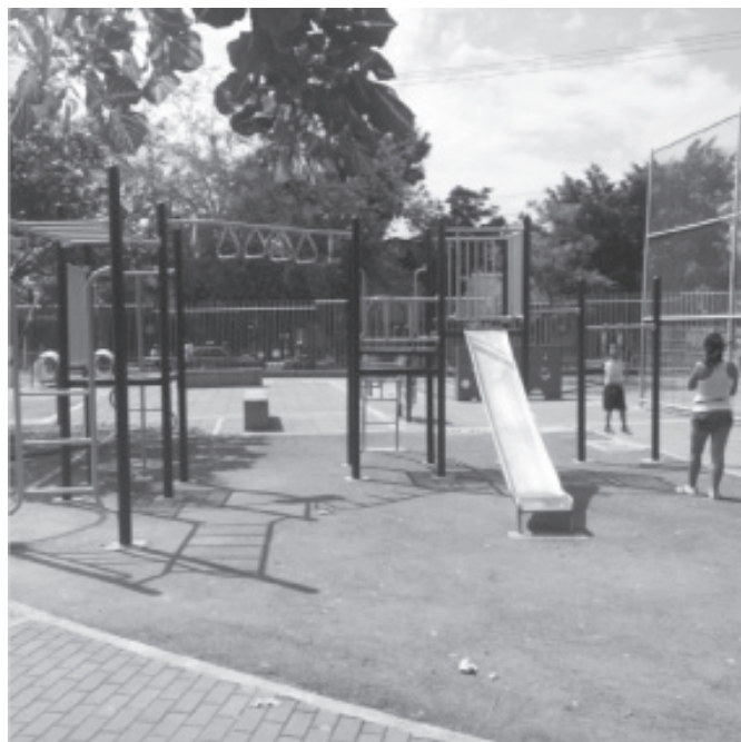
FOTO 17. PARQUE LA HORQUETA

Fuente: Registro fotográfico en visita de campo