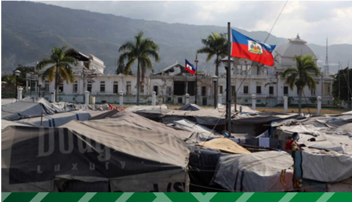
Imagen 7. Haití, dos años después del terremoto.

Una respuesta tentativa a la última pregunta propuesta puede encontrarse en la historia de Haití, en su pasado como colonia francesa y después estadounidense. Los haitianos, tras su independencia, recibieron una lección por tal temeridad: un bloqueo naval entre 1804 y 1863, dejándoles como su única solución el pago de una indemnización a Francia por la pérdida de propiedad colonial, incluyendo sus esclavos. Esta indemnización, equivalente a $31 billones de dólares, fue cobrada por Francia hasta 1947 y pagada a través de una deuda con bancos estadounidenses. Desde entonces, Estados Unidos pasó a ser el nuevo hegemón de Haití (Economic and Political Weekly, 2010).