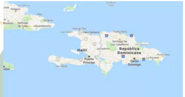
Imagen 2. Ubicación geográfica de Haití

La República de Haití, con la ciudad de Puerto Príncipe como su capital, es un país situado en la parte occidental de la isla La Española, ubicada en el Océano Atlántico; limita únicamente, por vía terrestre, con República Dominicana. También está conformada por las islas de Gonâve, Tortuga, Vaches, el archipiélago de las islas Cayemites y varios islotes, ocupando una superficie total de 27.750 km 2 . Actualmente (para junio de 2019), su población es de 11`321.747 de personas, ubicadas en 10 departamentos, 41 distritos y 133 comunas.