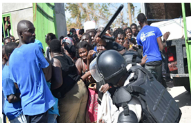
Imagen 6. Llegada de ayuda humanitaria en Haití.