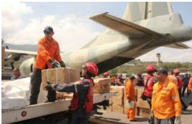
Imagen 5. Llegada de ayuda humanitaria en Haití.

Rusia, Reino Unido que tienen los recursos, pero no la soberanía para actuar directamente en el país, es un asunto a debatir para decidir cuál es la mejor manera de ayudar en la reconstrucción estatal de Haití.