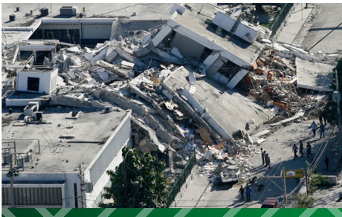
Imagen 3. Terremoto en Haití

Literalmente, se necesitó una sacudida de tal magnitud para despertar la preocupación, empatía y compromiso a nivel mundial. La ayuda provino de todas partes: ciudadanos estadounidenses exhortan a donaciones de dos dólares para ayudar, el Banco Mundial proporciona US$100 millones en ayuda de urgencia; el presidente ruso, que en ese año era Dimitri Medvédev, envió un avión de carga con un hospital de campaña, alimentos y medicamentos; varias multinacionales y multimillonarios, como Ted Turner que donó un millón de dólares, se unieron; no faltaron los Médicos sin Fronteras, ni la Cruz Roja Internacional, además de la misión de Naciones Unidas encargada.