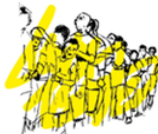
Imagen 4. Infografía Haití: 5 años del terremoto

Comparten una instalación de aseo 82 personas por término medio