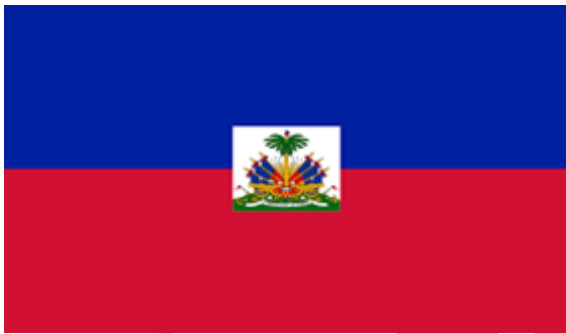
Imagen 1. Bandera de Haití.